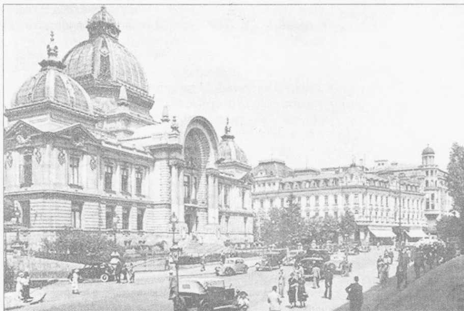
Casa de Economii și Hotelul Lafayette

25. Sunt nevoit să-mi opresc aici aceste foarte scurte flash-back -uri, nemaiaivând timp să purced mai departe cu Manole . Dar la pagina lui de final aş vrea să-i reamintesc că Palatul Poștelor (azi Muzeul de Istorie) este opera bunicului nostru, colonelul Mihail Ghica, care a avut inițiativa construirii lui (el a fost și director al Poștelor). Frumoasă și maiestuoasă clădire. De asemeni, reamintesc că vis-à-vis de Poșta, în dosul clădirii care adăpostea Sora și Loteria , pe micuța stradă Ilfov care iese la Splai , la malul Dâmboviței , mai există și azi „Palatul Ilfov ”, actualul Minister al Sănătății, clădit de banul Dumitrache Ghica și în care s-a născut bunicul. Când apele veneau mari - Dâmbovița nu era canalizată - familia și personalul ieșeau pe fereastră și se urcau în bărci care-i duceau sus pe deal, la adăpost. Aici era o capelă, în care fetele Ghica (mamele noastre) cântau de sărbători. (M.C.)